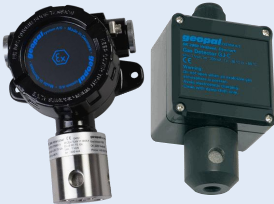
Geopal GJ-C Gasdetektor for Installation i uklassificerede områder